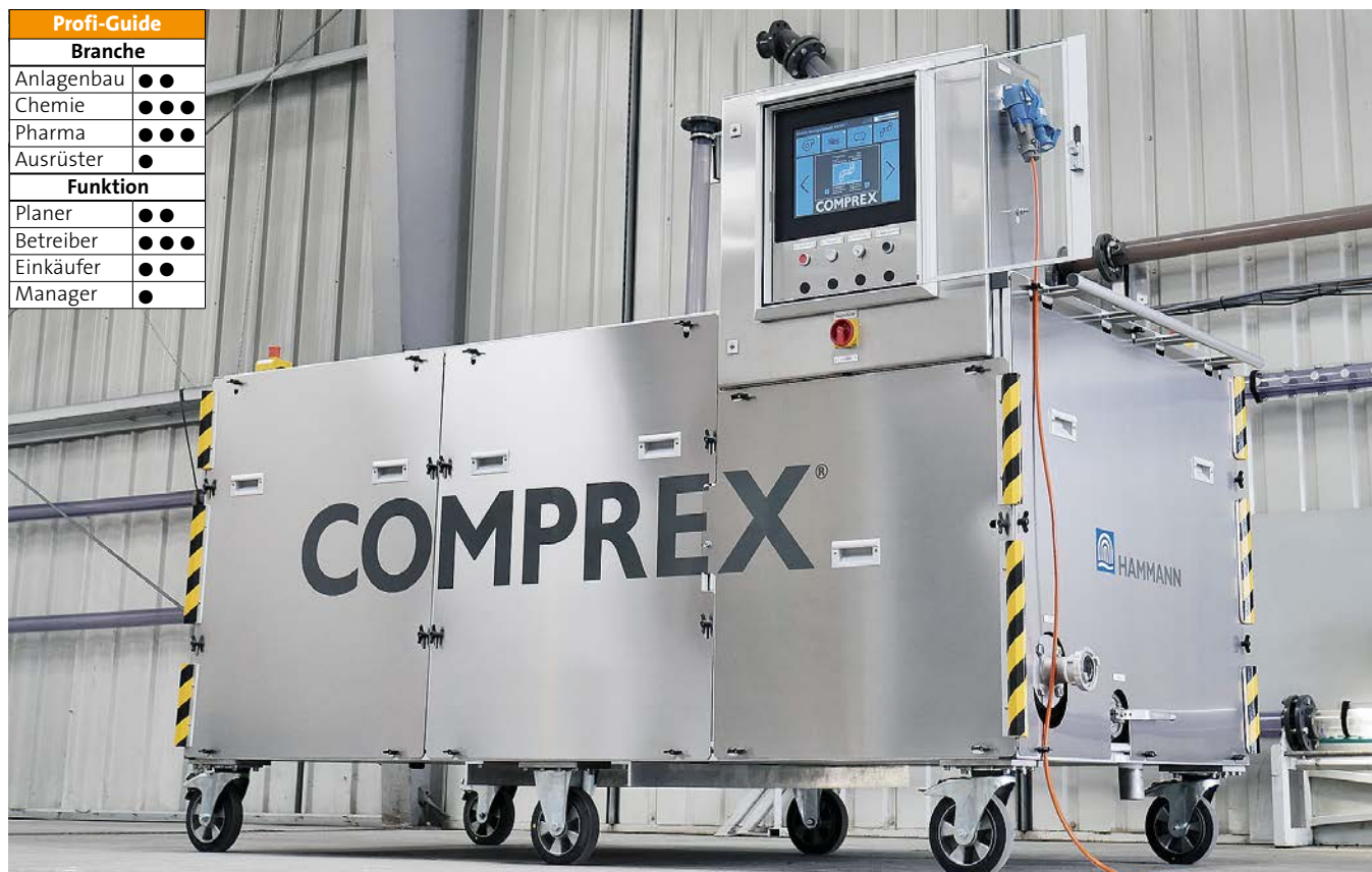
Prototyp der mobilen Complex-Unit zur Rohrreinigung